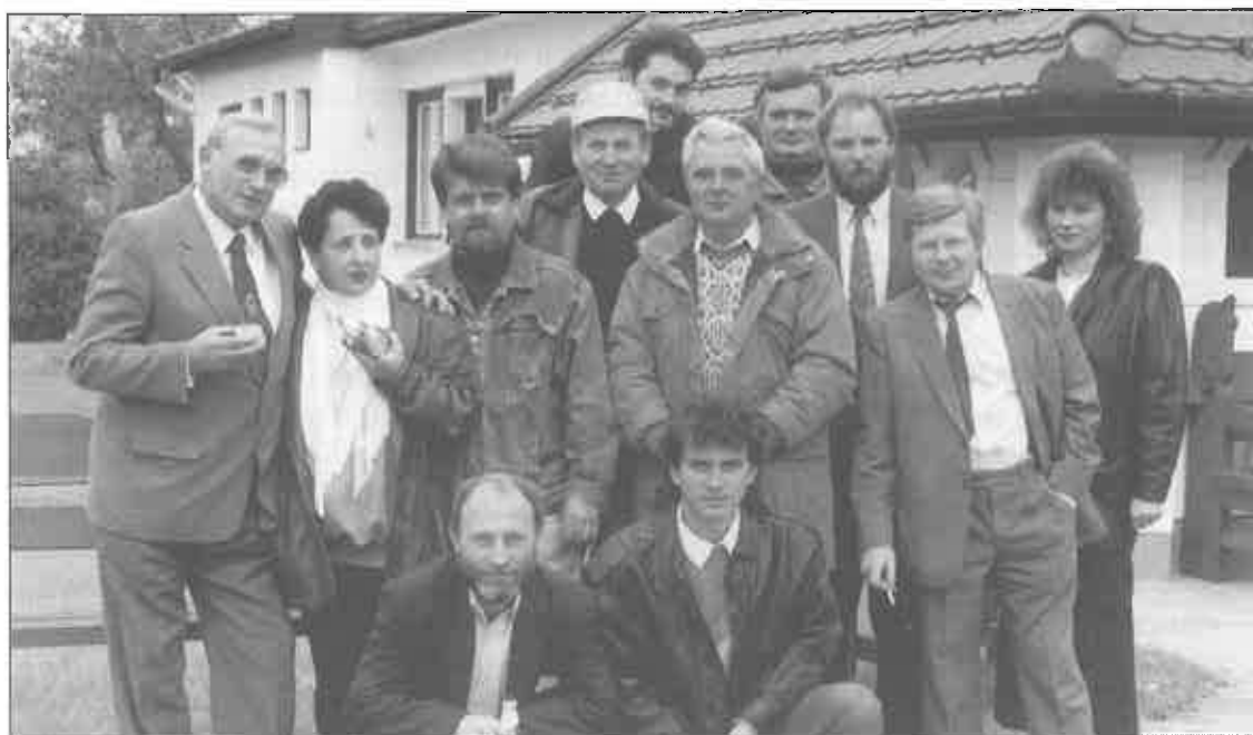
A velencei csoport és a hatvani vendégek