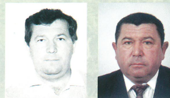
Knauz Testvérek csapat