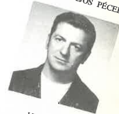
LIEGE III. DÍJ