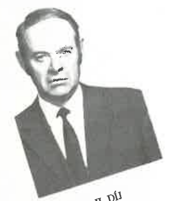
LIEGE II. DÍJ