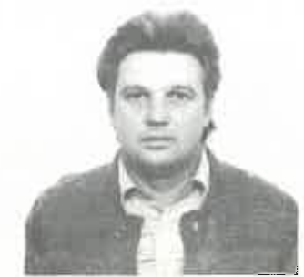
LIEGE ORSZ. CSAPAT I. DÍJ