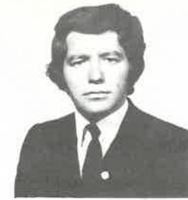
A MARATON KLUB BAJNOKA AACHEN ORSZ. CSAPAT I. DÍJ