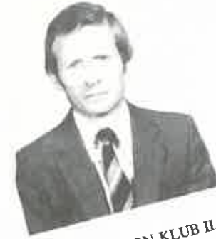
A MARATON KLUB II. LEGEREDMÉNYESEBB VERSENYZŐJE