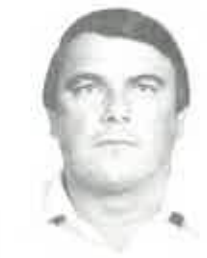
AACHEN I. DÍJ