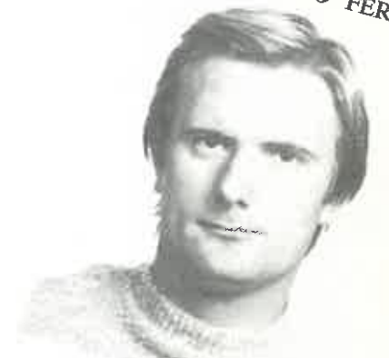
AACHEN III. DÍJ