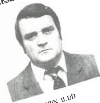
AACHEN II. DÍJ